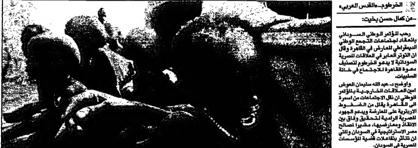
الجنرال سواديني في مسكر للاعلا في